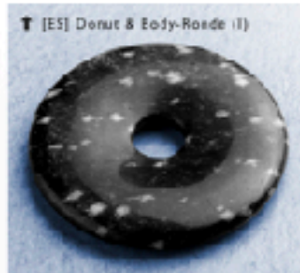
↑ [ES] Donut & Eddy-Roede (I)

Belangrijk Met de beschreven nauwkeurige meting met een STEZINGER G5-meter bepaal je exact waar welke Power Optimizers worden toegepast. Alle G5-waarden moeten bij voorkeur kleiner zijn dan 50 G5-eenheden, gemeten op alle stopcontacten. Het beste is onder 15 G5-eenheden. — Stopcontacten en stekkerblokken. ↑