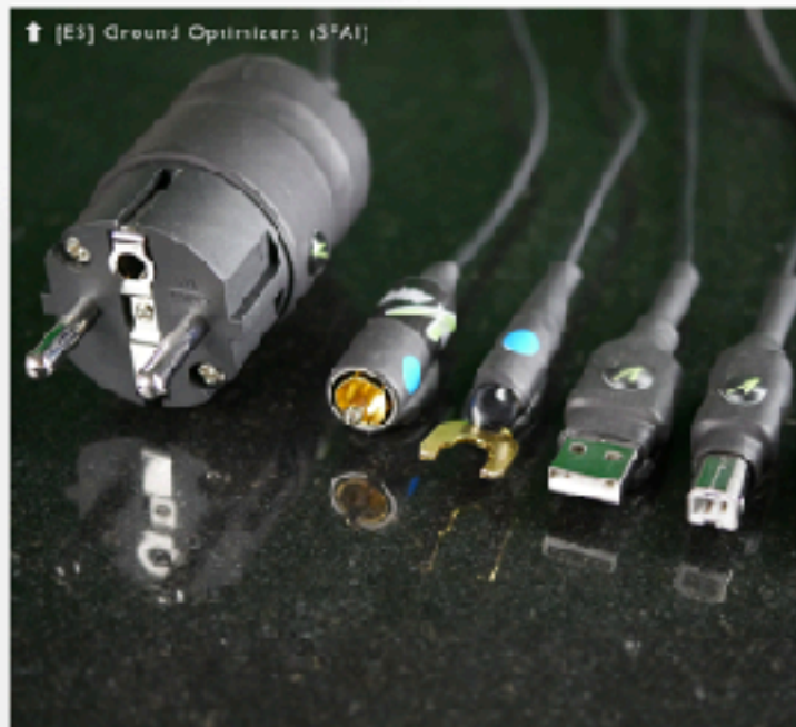
↑ [ES] Ground Optimizers (SFAI)

Luidsprekers, (voor/eind-) versterkers, CD-, platen-, NAS-spelers, D/A-converters, TV's, monitors, smart-phones, WiFi-routers, tablets, computers, batterijladers, stroomadapters, DECT-telefoons, SAT-receivers, glas- en metaalplaten, vloerverwarming, zekeringkasten, meterkast, radiatoren, lampen, alle kabelstekkers en verdeeldozen.