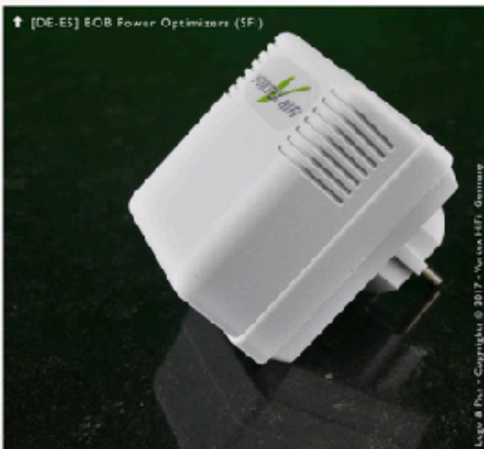
↑ [DE-ES] ECB Power Optimizers (SF)

!!! Gebruik ze NIET als geleidingsen of raadpleeg uw Vortex Hifi-dealer voor verdere instructies.