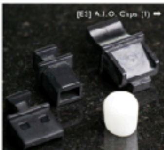
[ES] A.I.O. Caps (I) →

Alle open stopcontacten en in/sluitingen: RCA, RJ45, HDMI, USB-A en USB-B.