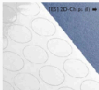
[ES] 2D-Chips (II) →

Luidsprekers, (voor/eind-) versterkers, CD-, platen-, NAS-spelers, D/A-converters, TV's, monitors, smart-phones, WiFi-routers, tablets, computers, muziekdragers, batterijladers, stroomadapters, DECT-telefoons, SAT-receivers, glas- en metaalplaten, vloerverwarming, zekeringkasten, radiatoren en alle kabelstekkers en verdeeldozen.