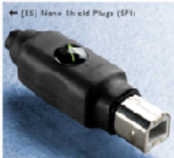
← [ES] Nano Shield Plugs (SF)

(Voor/eind-) versterkers, CD-, platen-, NAS-spelers, D/A-converters, TV's, monitors, smart-phones, WiFi-routers, tablets, computers, repeaters, DECT-telefoons en verdeeldozen. Opene aansluitingen, o.a.: RCA en XLR-M/F, RCA 75Ohm, RJ45-, USB-A/B, HDMI, Power.