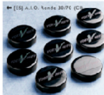
← [ES] A.I.O. Rende 30/70 (CB)

Luidsprekers, (voor/eind-) versterkers, CD-, platen-, NAS-spelers, D/A-converters, TV's, monitors, smart-phones, WiFi-routers, tablets, computers, batterijladers, stroomadapters, DECT-telefoons, SAT-receivers, glas- en metaalplaten, vloerverwarming, zekeringkasten, meterkast, radiatoren, lampen, alle kabelstekkers en verdeeldozen.