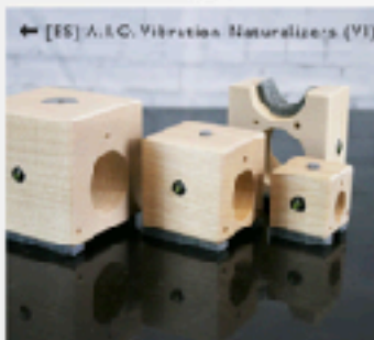
← [ES] A.I.O. Vibrations Naturalizers (VI)

Luidsprekers, (voor/eind-) versterkers, CD-, platen- en netwerkspelers, en luidsprekerlabels.